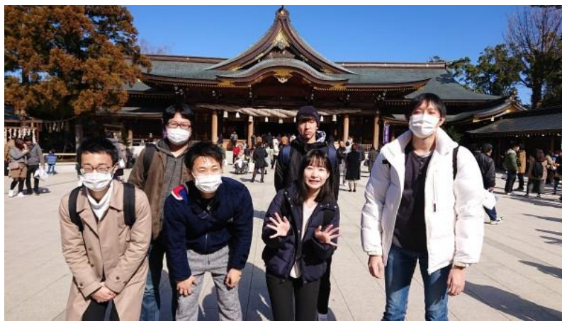
チームメンバーとエンジョイウォーキングを開催して コミュニケーションを深めています。※コロナ禍以前の実施